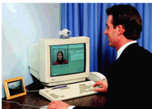
Video konferencija u izvođenju

Video konferencija je komunikacija putem koje se zvuk i slika u pokretu (video slika) izmjenjuju između dvije ili više lokacija. Najčešće se upotrebljava u poslovne svrhe i prilikom učenja na daljinu. Signal kojim se vrši prijenos slike i zvuka je digitalan, te može biti poslan na različite načine. Video konferencija najčešće se izvodi unutar lokalne mreže (npr. LAN) ili preko javne telefonske mreže (najčešće ADSL zbog financijske isplativosti i zadovoljavajuće kvalitete prijenosa). Korištenjem računalne i komunikacijske tehnologije video konferencija omogućava ljudima na različitim lokacijama da se međusobno vide i čuju.